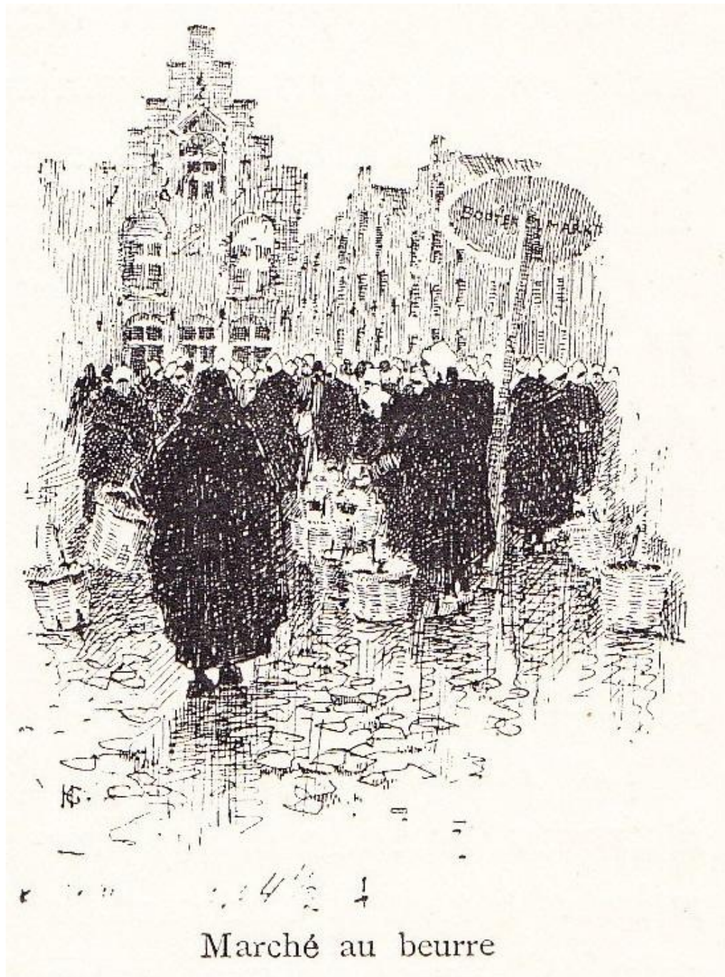
Marché au beurre